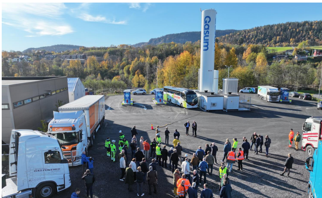
SATSER: Biogassstasjonen på Skui er Gasums syvende stasjon for flytende biogass (LBG) i Norge.

Publisert på www.lastebil.no Av Elisabeth Nodland