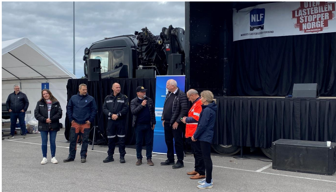
Samtaler både på og utenfor scenen

Fylkesavdelingene i NLF region 3 arrangerte i år felles høsttreff på Furulund døgnhvileplass. NLF Vestfold sto som arrangør, og hadde satt sammen et innholdsrikt program.