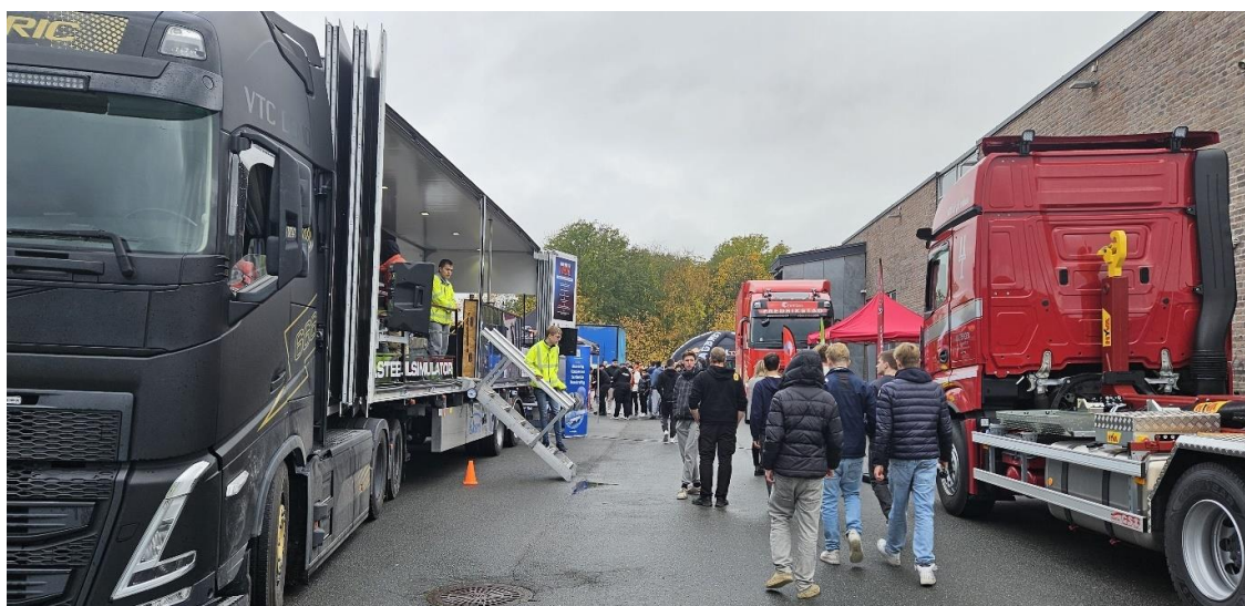
Følg Drømmen turneen på Åssiden videregående skole

En av de lokale bedriftene som veldig ofte er å se på denne type rekrutteringsarrangement kunne fortelle at det har gitt dem konkrete resultater. De har funnet lærlinger og ansatte ved å være ute ved slike anledninger for å møte unge som er interessert i utdanning eller jobb.