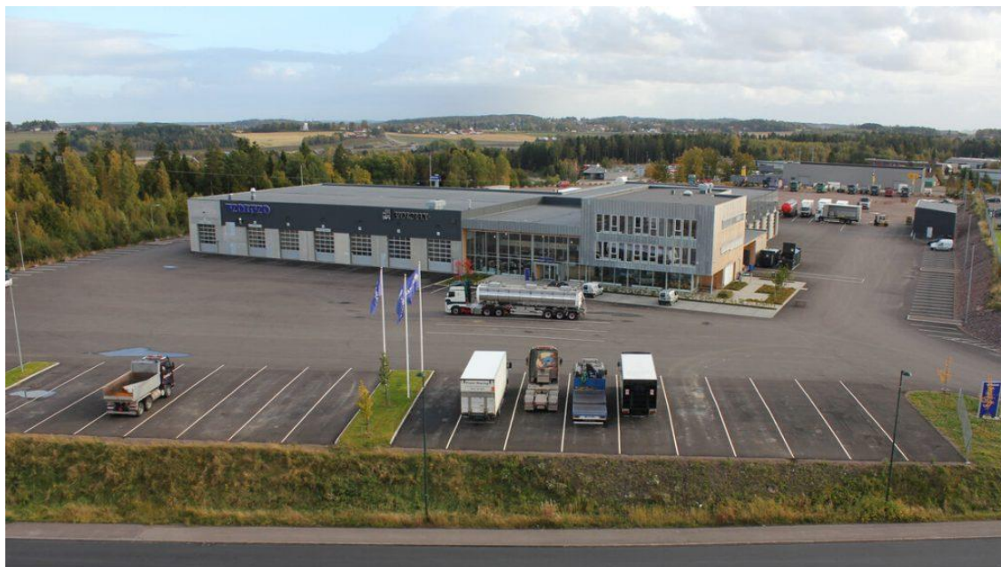
Her hos Volmax på Borgeskogen blir årets julemøte i NLF Vestfold 28. november

Sett av 28. november til årets julemøte i NLF Vestfold. I år blir det både nytt opplegg og nytt tidspunkt.